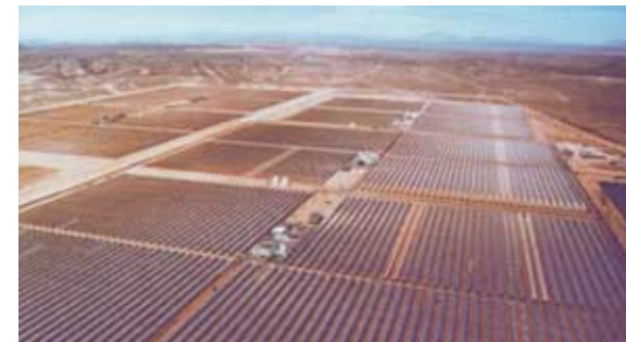
Parabolrinnen – Dampfkraftwerk

Grundlastbetrieb. Da lediglich der direkte Anteil der Sonneneinstrahlung gebündelt werden kann, kommen als Standorte hauptsächlich die trockenen und heißen Zonen der Erde südlich des 40. Breitengrades in Frage.