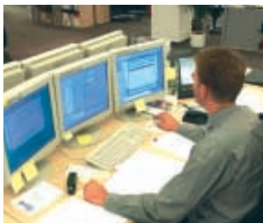
E.ON Sales & Trading: Hier entsteht der Einsatzplan für die Kraftwerke

Kraftwerke sind dazu da, um rund um die Uhr Strom zu produzieren – so zumindest das weit verbreitete Bild in der Öffentlichkeit. Dass die Anlagen nicht immer, häufig mit wechselnder Leistung und manchmal gar nicht am Netz sind, ist vielen Außenstehenden nicht bewusst. Und nach welchen Kriterien die einzelnen Anlagen im Kraftwerkspark der E.ON Kraftwerke eingesetzt werden, ist zum Teil sogar für die eigenen Mitarbeiter nur schwer nachzuvollziehen.